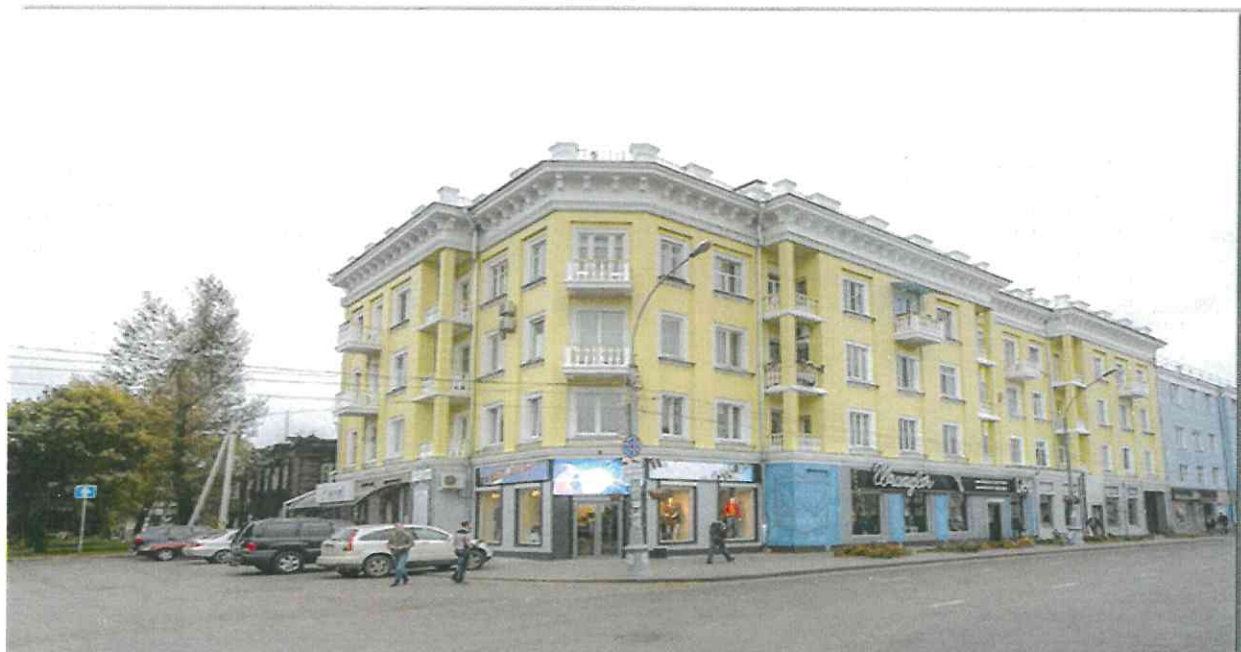
Рис 1. Многоквартирный дом по адресу: г. Иркутск, ул. Карла Маркса, д.№ 32/1.

В соответствии с Краткосрочным планом 2014 в 2014-2015 годах был проведен капитальный ремонт в 95 многоквартирных домах, общей площадью 304,4 тыс. кв. м., расположенных на территории 12 муниципальных образований Иркутской области.