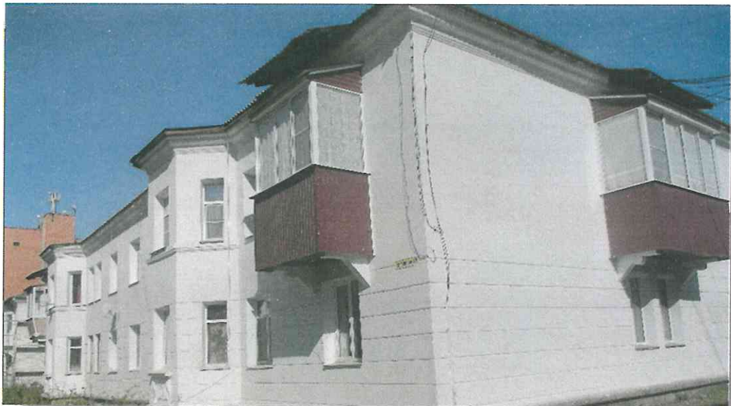
Рис. 5. Многоквартирный дом по адресу: г. Усть-Кут, ул. Кирова, д.№ 29.

Информация о проведенных капитальных ремонтах в рамках Краткосрочного плана 2014 внесена в федеральную автоматическую информационную систему «Реформа ЖКХ».