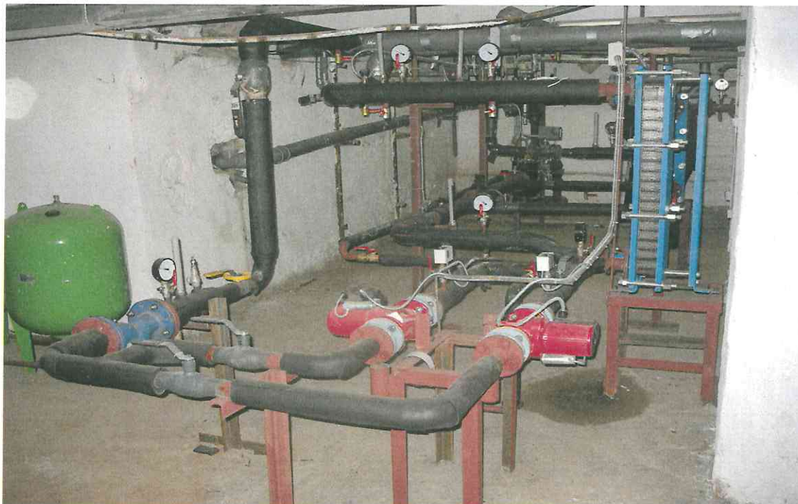
Рис 3. Многоквартирный дом по адресу: г. Иркутск, ул. Канадзавы, д.№ 3. (автоматизированный погодоведомый узел управления тепловой энергией)

совета Фонда капитального ремонта многоквартирных домов Иркутской области (далее – технический совет Фонда). На каждом заседании Технического совета Фонда рассматривались вопросы, поступившие от подрядных организаций, собственников помещений многоквартирных домов, организаций, осуществляющих управление многоквартирными домами, представителей муниципальных образований Иркутской области, общие вопросы, выносимые на обсуждение представителями Фонда.