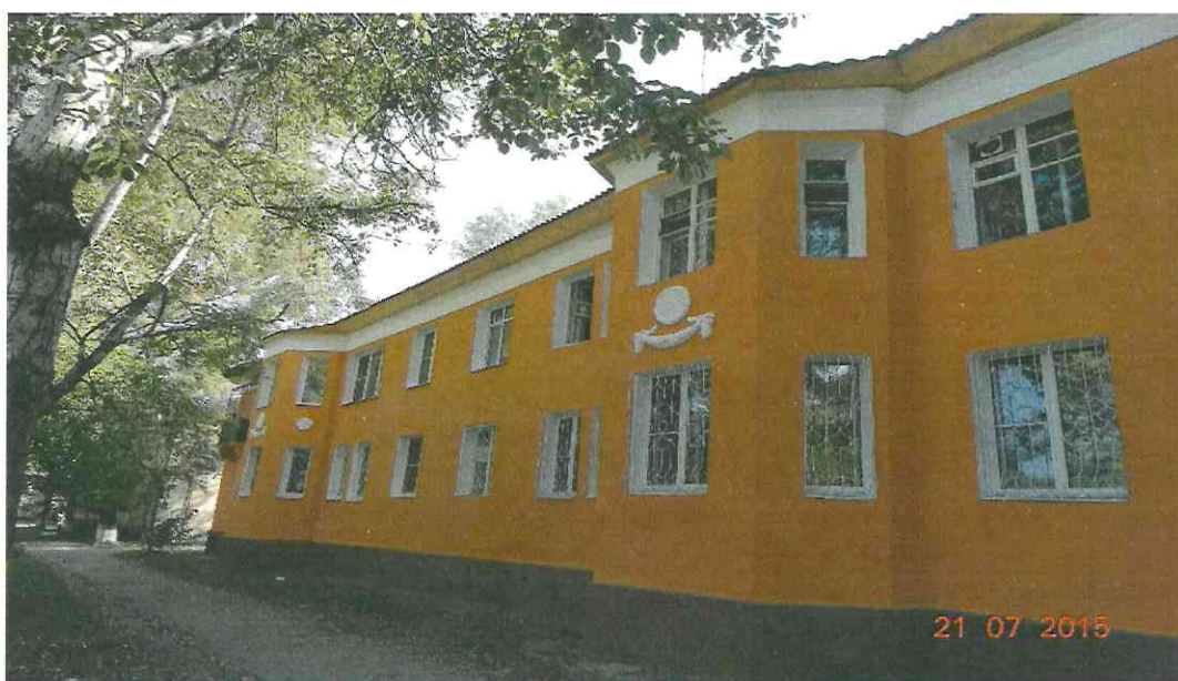
Рис 4. Многоквартирный дом по адресу: г.Усолье-Сибирское, ул.Толбухинв, д.№ 26.

Всего Фондом принято 625 работ (ремонт внутридомовых инженерных сетей электро-, тепло-, водоснабжения, водоотведения, замена лифтового оборудования, крыши, подвальных помещений, фасада, услуг строительного контроля) проведенных в рамках Краткосрочного плана 2014.