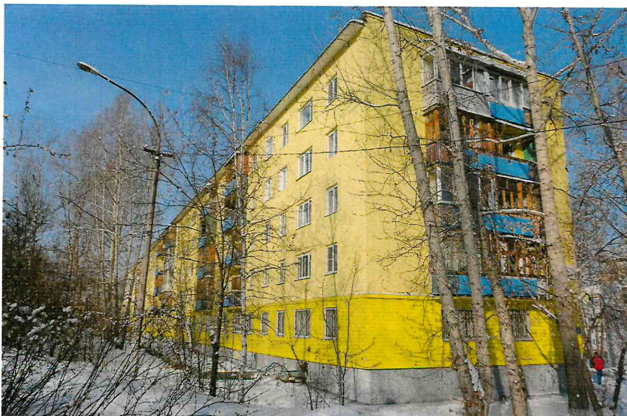
Многоквартирный дом по адресу: г. Железногорск-Илимский кв. 6 д. 4

Акт визуального обследования согласовывается с представителями органа местного самоуправления, организации, осуществляющей управление многоквартирным домом, а также с председателем Совета многоквартирного дома либо председателем ТСЖ, ЖСК, или иным представителем собственников помещений многоквартирного дома. В 2016 году было обследовано 332 многоквартирных дома по 29 муниципальным образованиям, в том числе 26 МКД повторно по обращениям собственников для корректировки видов и объемов работ плана капитального ремонта на 2017 год.