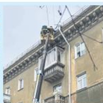
Фонд капитального ремонта многоквартирных домов пришел в газету «Иркутск». Прямо сейчас, когда вы читаете этот номер, идет работа по ремонту крыши на здании по адресу: улица Горького, 27, где располагается наша редакция